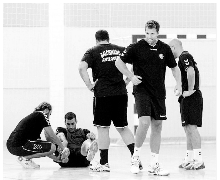
ENTRENAMIENTO. El equipo se ejercitó ayer.